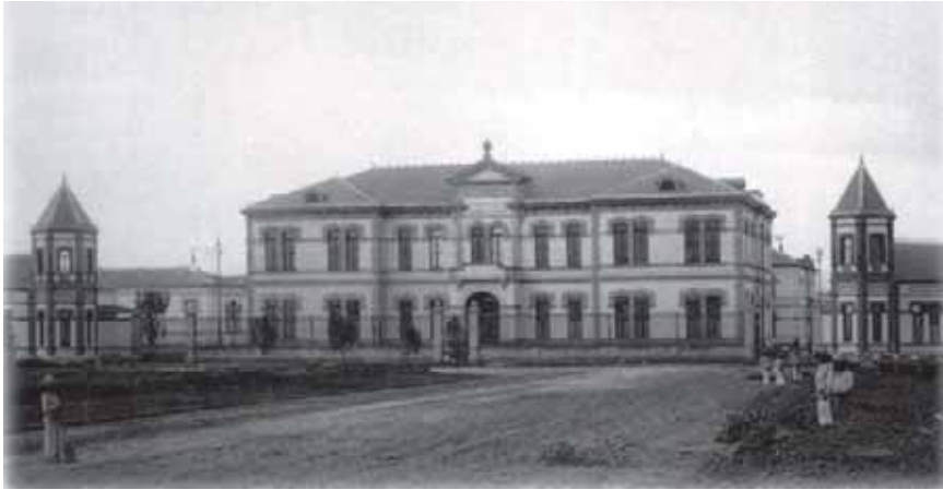
Figura 2. Hospital General de México, 1904. En: Centenario del Hospital General: Historia de la Medicina Mexicana. México: Lunweg Editores; 2004. portada.

de la Iglesia Católica, incluyeron la supresión de las comunidades religiosas de monjas y frailes y la secularización de todos los hospitales y establecimientos de beneficencia. Estas comunidades religiosas habían sido los proveedores de servicios de atención a los enfermos hospitalizados desde el inicio de la época virreinal, en el siglo XVI.