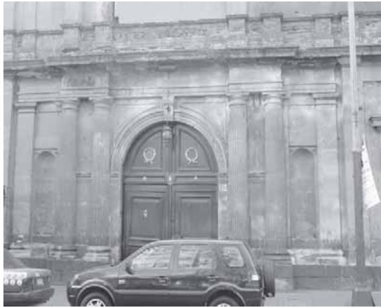
Figura 3. Antigua Hospital de Maternidad e Infancia. Esquina Calle Revillagigedo y Calle Artículo 123, Col Centro.

El 21 de abril de 1898, el Secretario de Gobernación envió al Dr. Liceaga el decreto Presidencial inaugurando la "Escuela Práctica y Gratuita de Enfermeros", adscrita al Hospital de Maternidad e Infancia, ubicado en la Calle de Revillagigedo (figura 3). Alfred y Lillie Cooper fueron contratados como profesores por un salario de 75 pesos al mes por un periodo de seis meses. 6