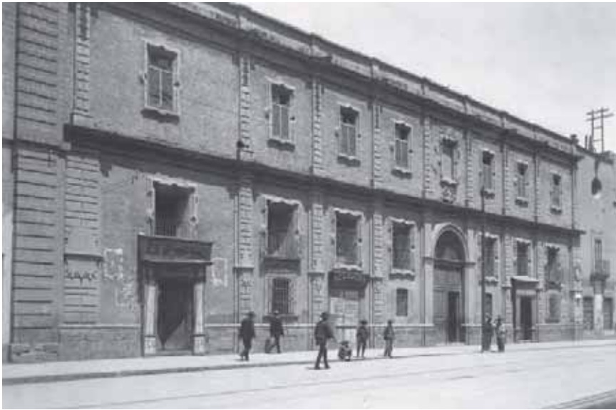
Figura 5. Hospital de San Andrés, c. 1904. En: Centenario del Hospital General: Historia de la Medicina Mexicana. México: Lunweg Editores; 2004. p. 172.