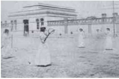
Enfermeras del Hospital General de México jugando tenis, 1907. En: El Hospital General: Una Gran Casa de Beneficencia, de la revista El Mundo Ilustrado 1907;1(25):11

Directora Warden, los médicos evidenciaron su control sobre las enfermeras y su formación profesional.