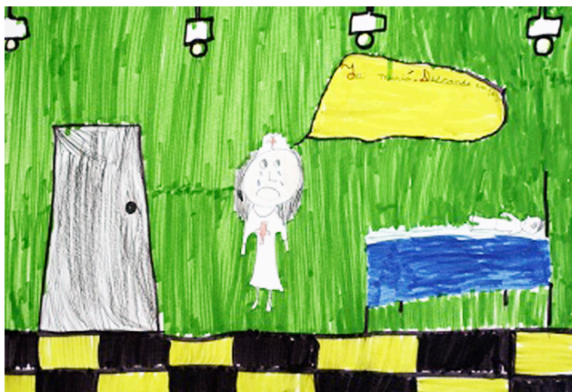
Dibujo 3 “También ayudamos al buen morir”