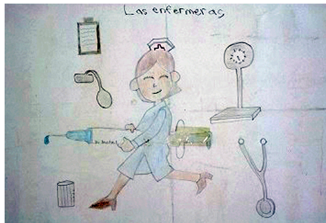
Dibujo 5 "Las enfermeras"