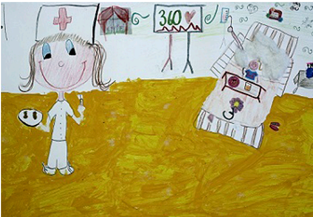
Dibujo 1 Un día en el hospital

Autora: Samantha (10 años) Concurso de Dibujo Infantil con técnica libre "A qué se dedican las enfermeras"